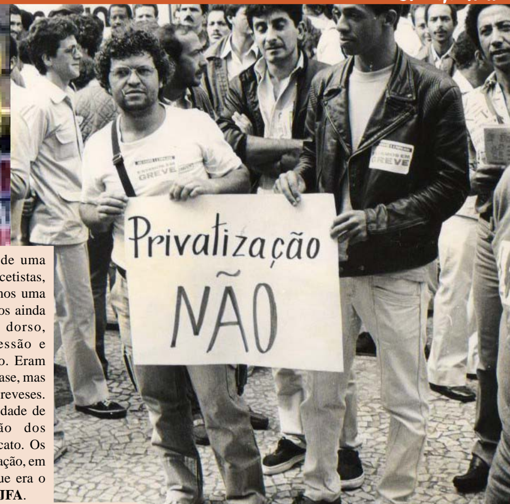
As fotos em preto e branco são de 1990, referindo-se à greve e à manifestação contra fechamento da DR em Juiz de Fora. As fotos mais recentes mostram as manifestações pelo cumprimento do Termo de Compromisso assinado em 2007, reivindicando o Adicional de Risco

Parabenizamos esta categoria, principalmente os associados, pela coragem e crença na organização sindical, sendo o único caminho para o crescimento e o respeito da classe trabalhadora.